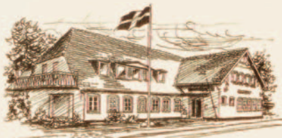
Kongelig Privilegeret siden 1566